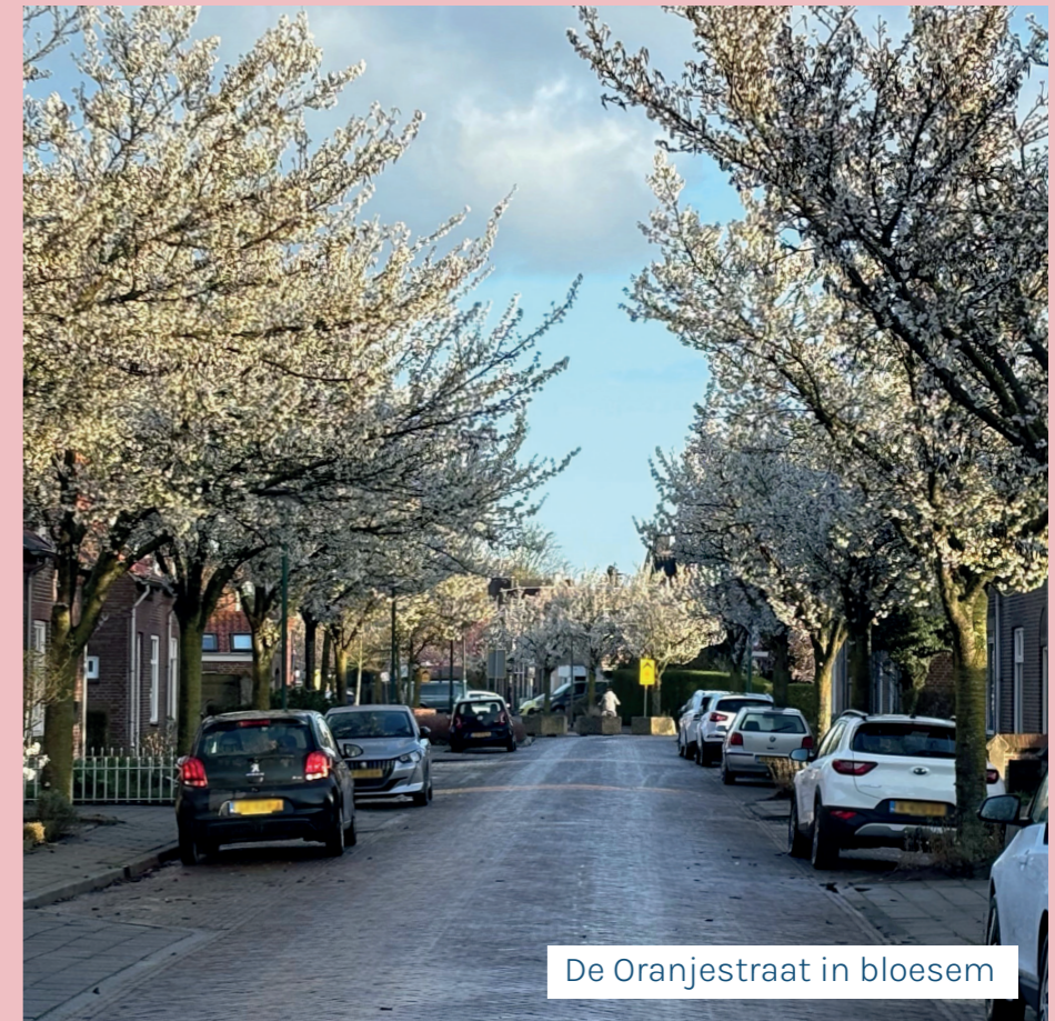
De Oranjestraat in bloesem